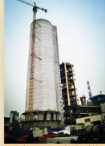
亭亭玉立

“身边的精彩与感动”主题征文、微镜头征集活动开展一个多月以来,已收到了许多员工的作品,大家以文字、图片、视频的形式把我们身边的精彩