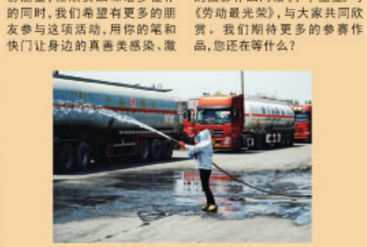
劳动最光荣

与感动展现的淋漓尽致,让我们身边一个个默默无闻的人物鲜活起来,将我们身边一幕幕精彩瞬间永远的定格了下来。本期为大家展示部分参赛作品。本期为大家展示的是王敏的摄影作品两幅《亭亭玉立》与《劳动最光荣》,与大家共同欣赏。我们期待更多的参赛作品,您还在等什么?